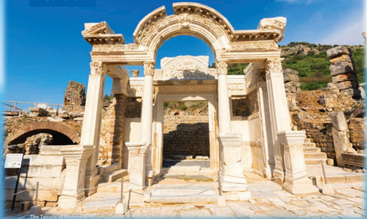
The Temple of Hadrian