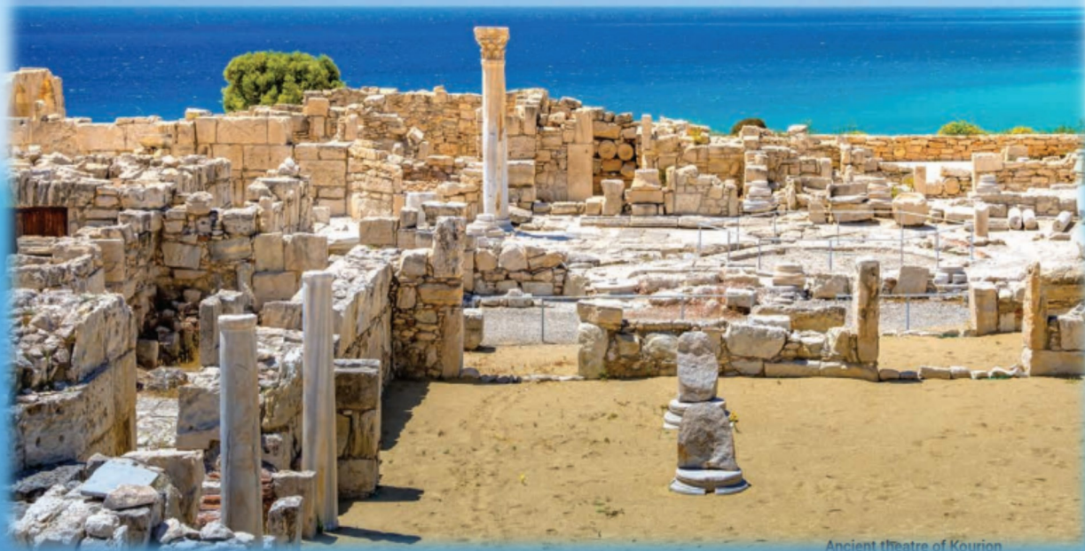
Ancient theatre of Kourion