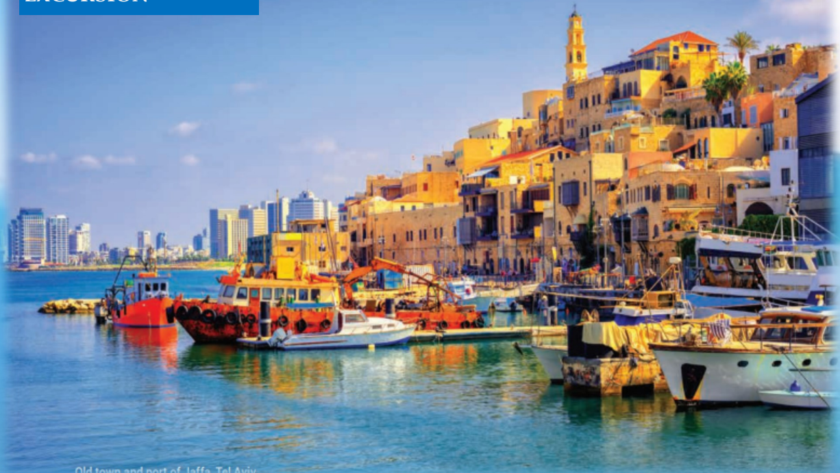
Old town and port of Jaffa, Tel Aviv